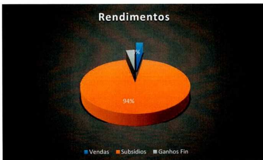
Gráfico com a estrutura de rendimentos: